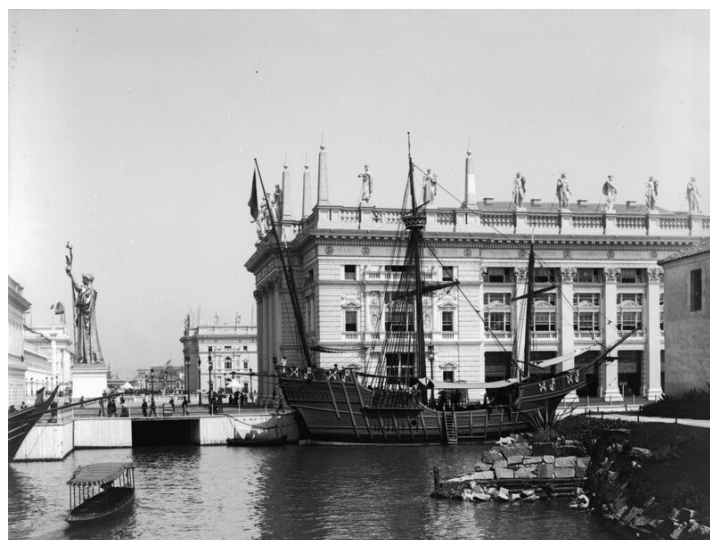
Fig. 5 Vista de la “World Columbus Exposition” desde el lago Michigan con la réplica de la “Santa María”, el barco preferido de Colón.