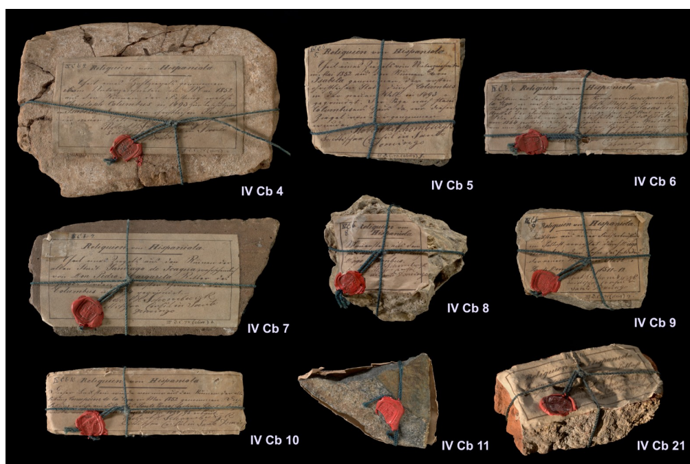
Fig. 1 Materiales de construcción de diferentes edificios de los primeros asentamientos españoles en La Española. Colección de Robert Schomburgk, Staatliche Museen zu Berlin - Ethnologisches Museum, IV Cb 4-11, 21.