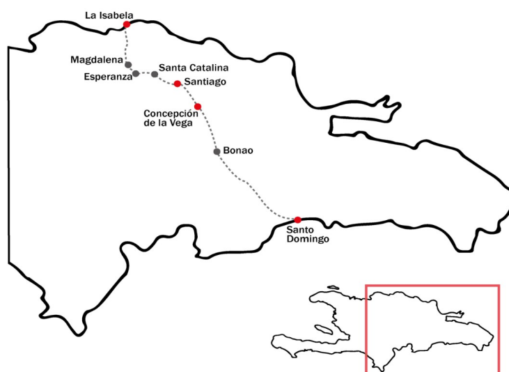
Fig. 3 Mapa de Hispaniola con la localización de los asentamientos españoles.

La Isabela fue fundada en el segundo viaje de Cristóbal Colón el 2 de enero 1494 con la intención de establecer “una factoría real o asentamiento comercial” (Deagan & Cruxent 2002 a: 3). 16 El asentamiento fundado en el primer viaje, La Navidad , en la parte noroccidental de la isla, había sido destruido por los Taíno. El nuevo lugar que Colón escogió, ahora en el nororiente de la isla, la llamó La Isabela , en honor a la reina española. Las fuentes coloniales son muy entusiastas refiriéndose al lugar escogido por Colón: una bahía amplia y protegida por una costa escarpada y una densa vegetación, agua dulce disponible, con una llanura adyacente para la agricultura y materiales de construcción disponibles, piedras, cal y arcilla, para la producción de ladrillos. La situación era estratégica cerca del Valle del Cibao, “el lugar donde abundan las rocas, con los yacimientos de oro” (Deagan & Cruxent 2002 a: 50-52). 17