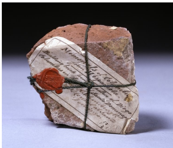
Fig. 4 Memorials of Columbus from Hispaniola, Palace of Diego Columbus. British Museum, London, 1853.0101.6

Esta diferencia en las designaciones de la colección alemana y la británica a primera vista es sorprendente, ya que los términos correspondientes existen en ambos idiomas. "Reliquie" en alemán corresponde a "relic" en inglés. El término "memorial" en inglés sería "Andenken" en alemán, lo que significa "un objeto que sirve de memoria de algo", un sinónimo de "souvenir".